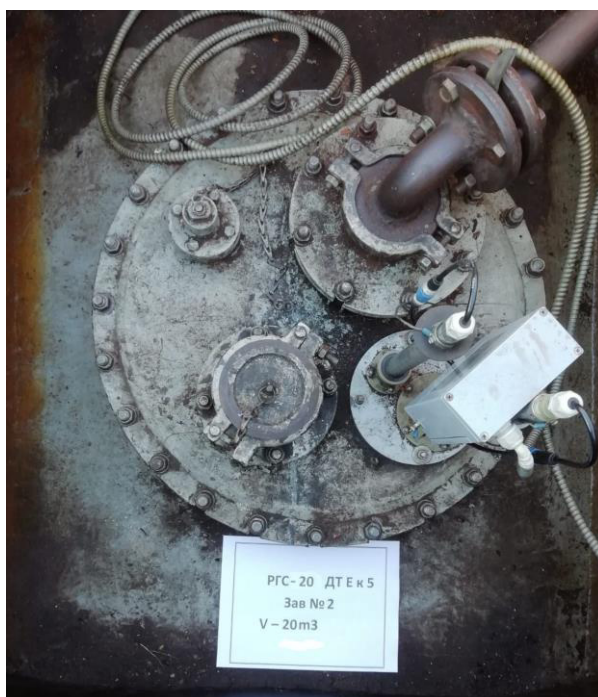
Рисунок 2 – Горловина резервуара РГС-20

Пломбирование резервуара РГС-20 не предусмотрено.