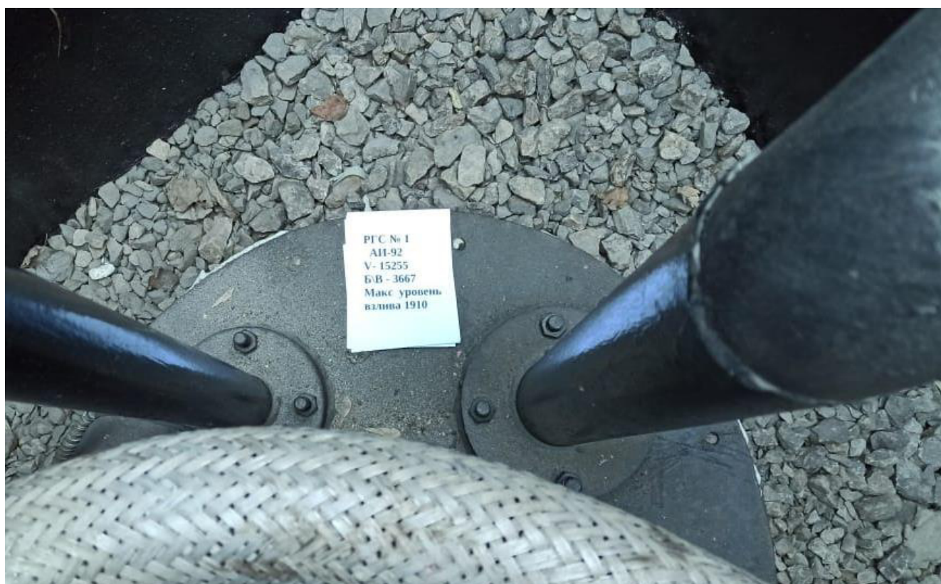
Рисунок 2 – Горловина резервуара РГС-15 №1