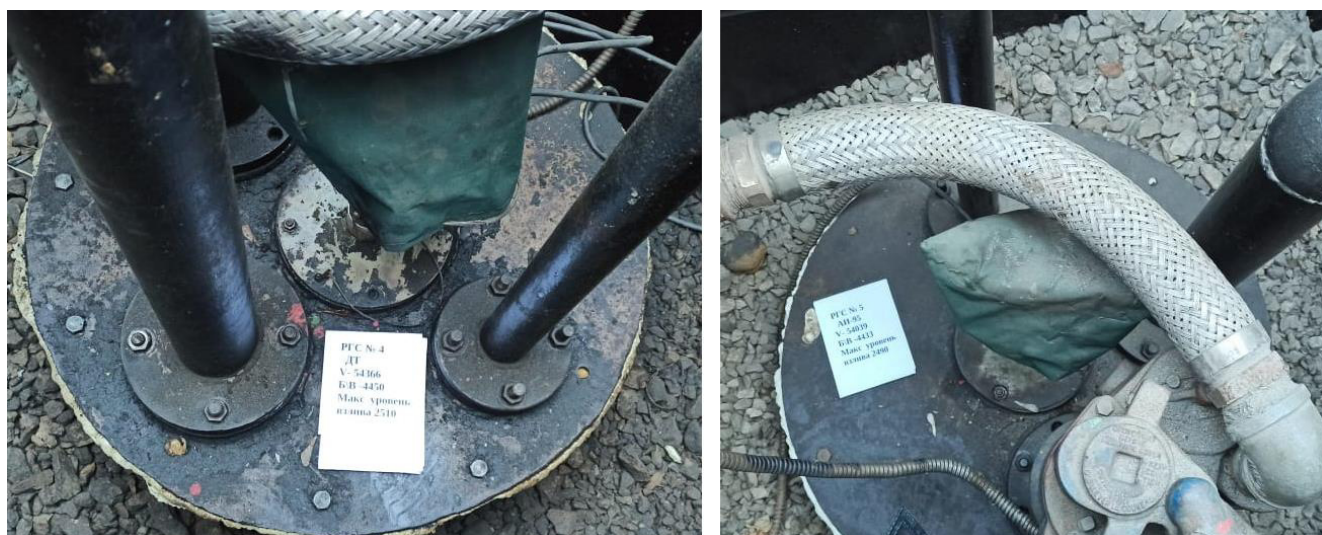
Рисунок 3 –Горловины резервуаров РГС-50 №№4, 5