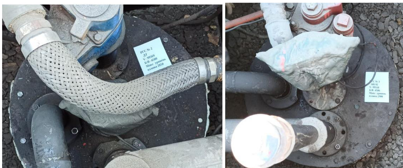
Рисунок 4 –Горловины резервуаров РГС-100 №№2, 3

Пломбирование резервуаров РГС не предусмотрено.