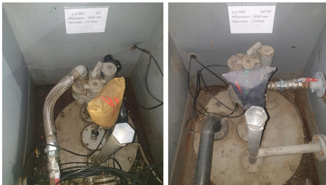
Рисунок 3 –Горловины резервуаров РГС-25 №№5, 6