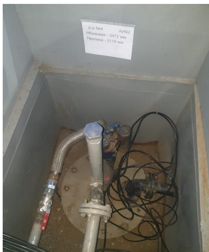
Рисунок 2 – Горловина резервуара РГС-20 №4