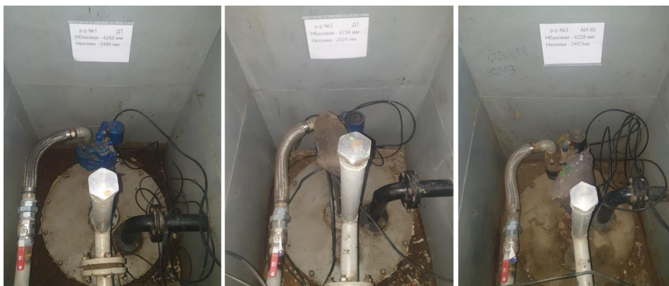
Рисунок 4 –Горловины резервуаров РГС-60 №№1, 2, 3

Пломбирование резервуаров РГС не предусмотрено.