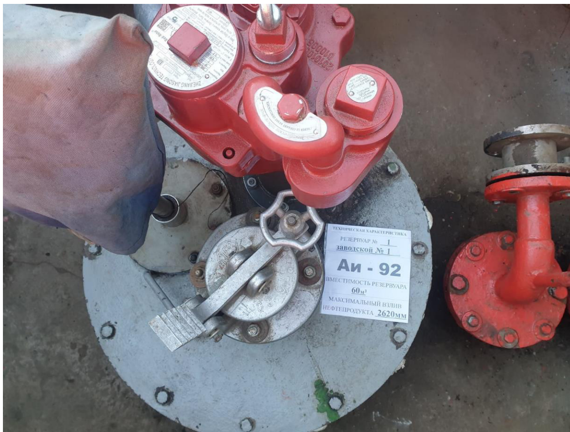
Рисунок 3 – Горловина резервуара РГС-60 №1

Пломбирование резервуаров РГС не предусмотрено.