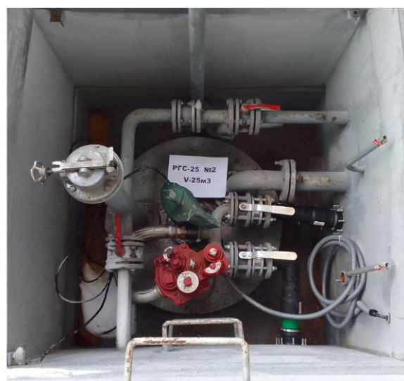
Рисунок 2 – Горловины резервуаров РГС-25 зав.№№ 1, 2