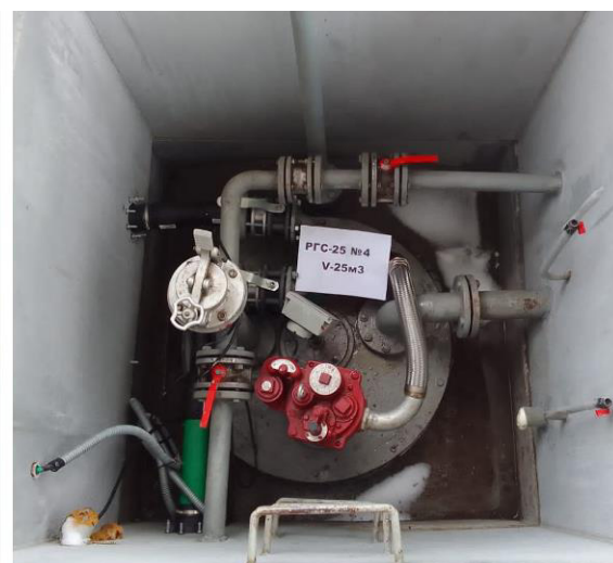
Рисунок 3 – Горловины резервуаров РГС-25 зав.№№ 3, 4