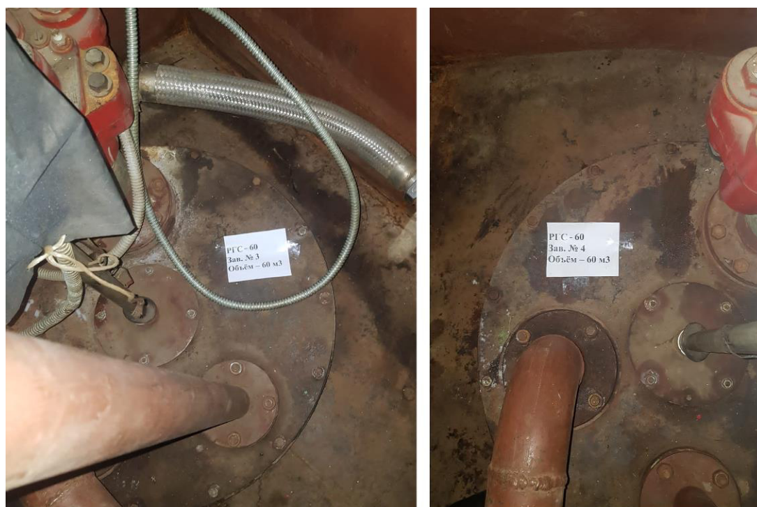
Рисунок 4 – Горловины резервуаров РГС-60 зав.№№3, 4

Пломбирование резервуаров РГС не предусмотрено.