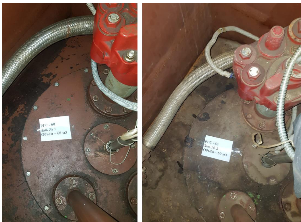
Рисунок 3 – Горловины резервуаров РГС-60 зав.№№1, 2