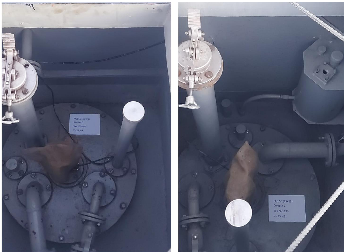
Рисунок 3 – Горловины резервуара РГД 50 (25+25) зав.№ 1190

Пломбирование резервуаров РГД 50 (25+25) не предусмотрено.