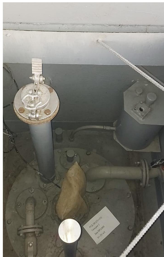
Рисунок 2 – Горловины резервуара РГД 50 (25+25) зав.№ 1089