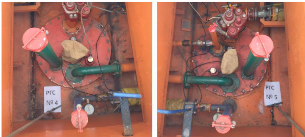
Рисунок 2 – Горловины резервуаров РГС-25 зав.№№ 4, 5