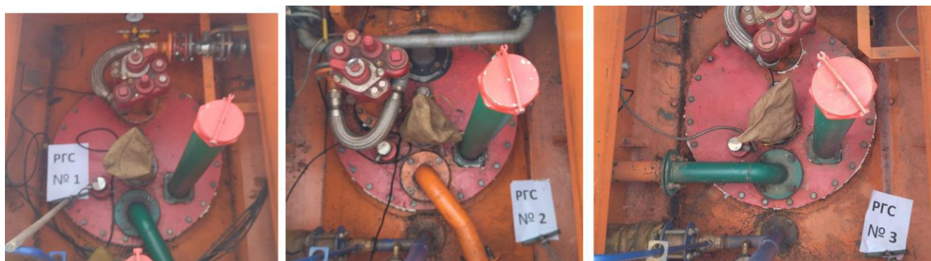
Рисунок 3 – Горловины резервуаров РГС-50 зав.№№ 1, 2, 3

Пломбирование резервуаров РГС не предусмотрено.