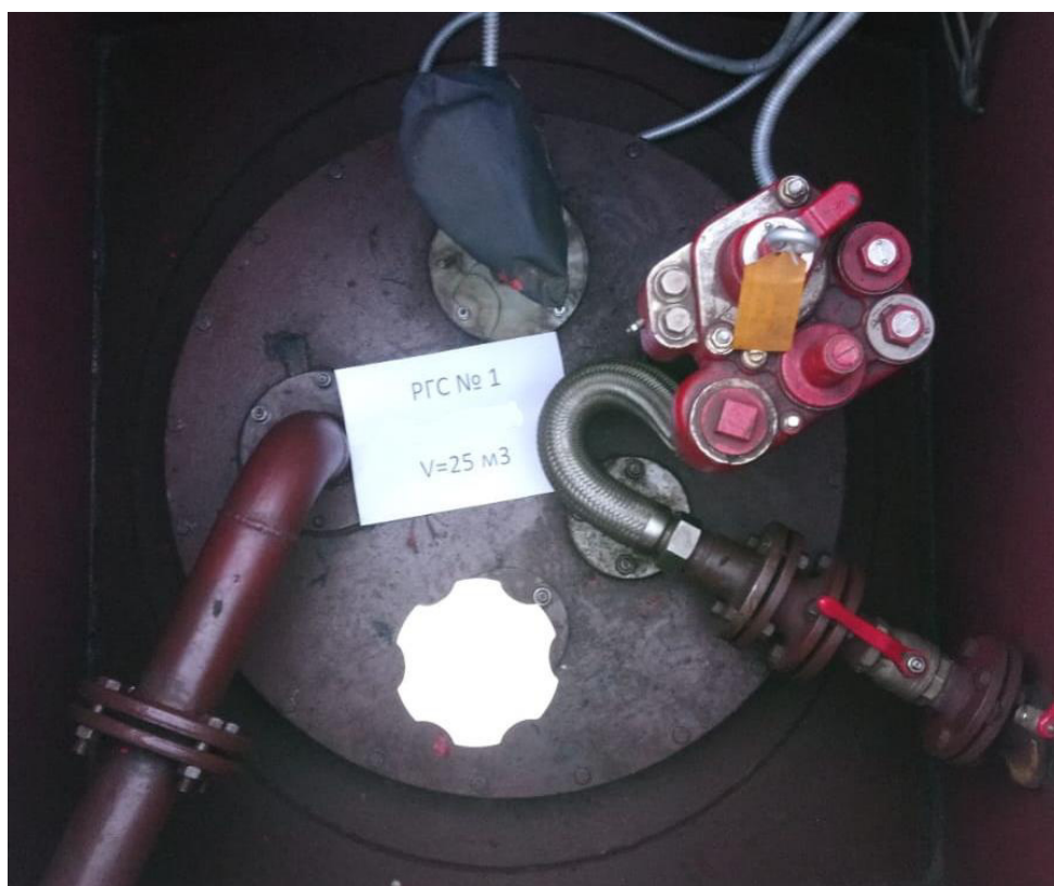
Рисунок 2 – Горловина резервуара РГС-25 зав.№ 1