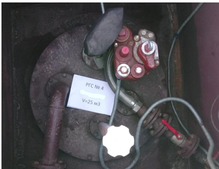
Рисунок 5 – Горловина резервуара РГС-25 зав.№ 4

Пломбирование резервуаров РГС-25 не предусмотрено.