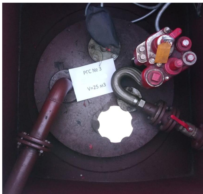
Рисунок 4 – Горловина резервуара РГС-25 зав.№ 3