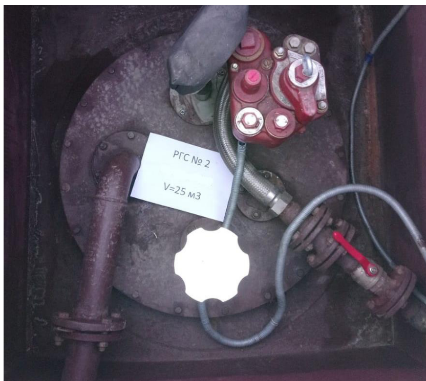
Рисунок 3 – Горловина резервуара РГС-25 зав.№ 2