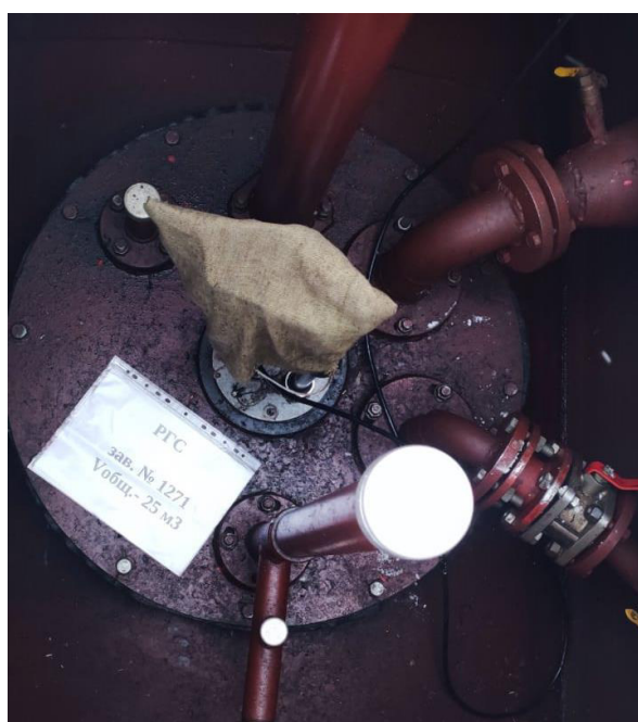
Рисунок 3 – Горловина резервуара РГС-25 зав.№ 1271