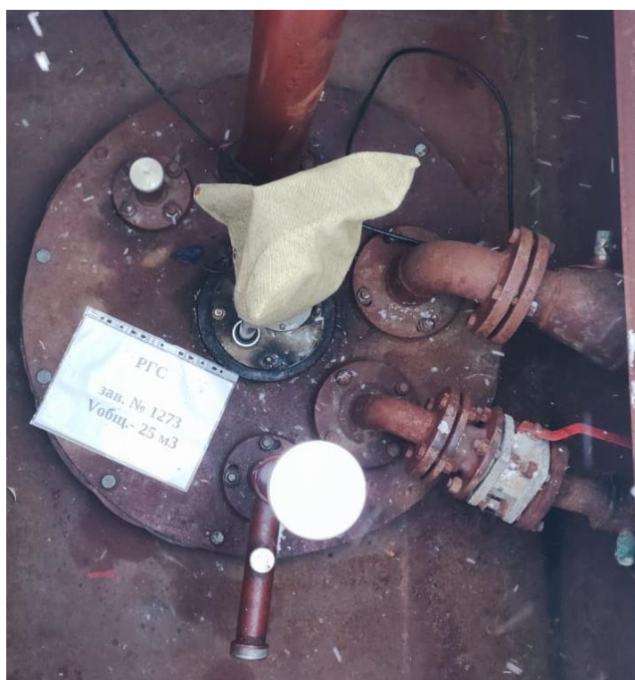
Рисунок 5 – Горловина резервуара РГС-25 зав.№ 1273