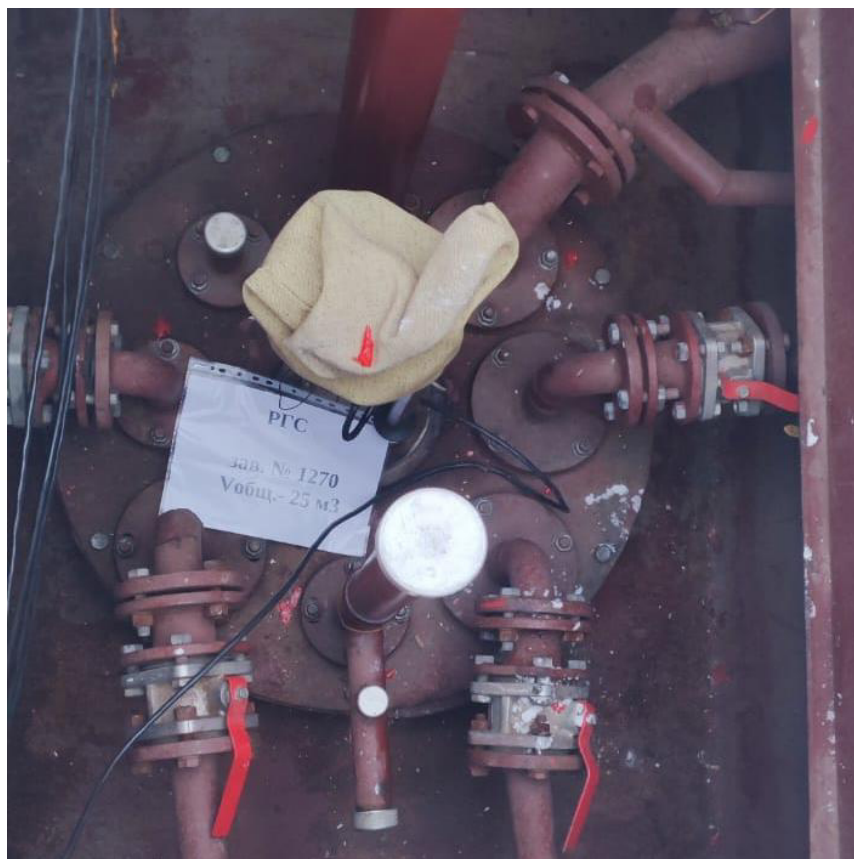
Рисунок 2 – Горловина резервуара РГС-25 зав.№ 1270