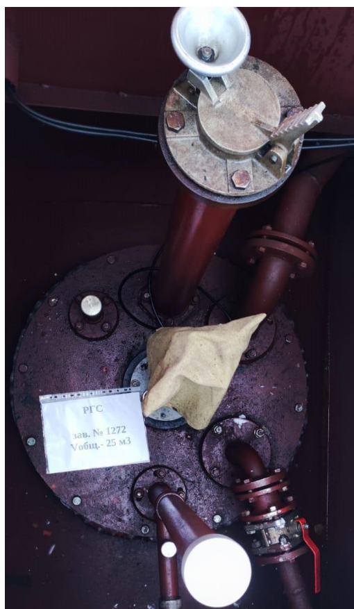
Рисунок 4 – Горловина резервуара РГС-25 зав.№ 1272