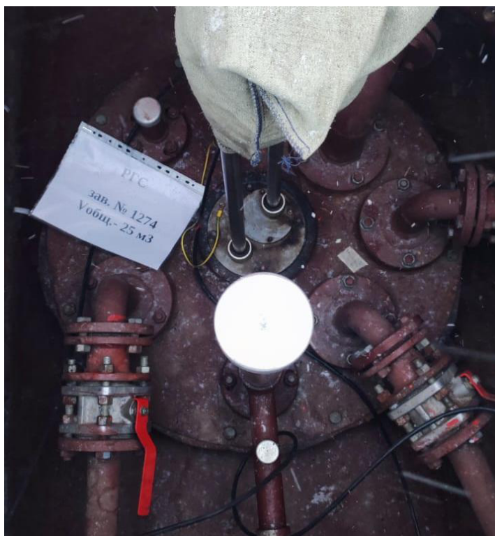
Рисунок 6 – Горловина резервуара РГС-25 зав.№ 1274

Пломбирование резервуаров РГС-25 не предусмотрено.