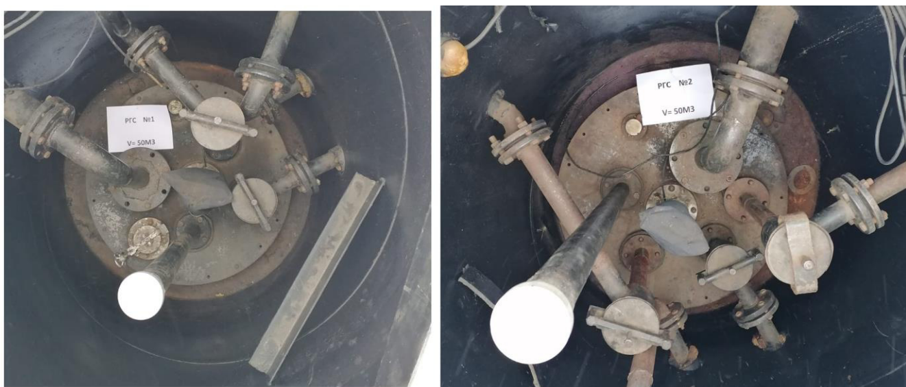
Рисунок 4 – Горловины резервуаров РГС-50 зав.№№1, 2

Пломбирование резервуаров РГС не предусмотрено.