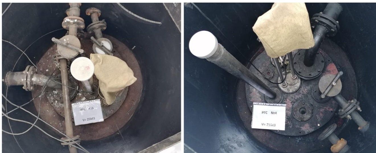
Рисунок 3 – Горловины резервуаров РГС-25 зав.№№3, 4