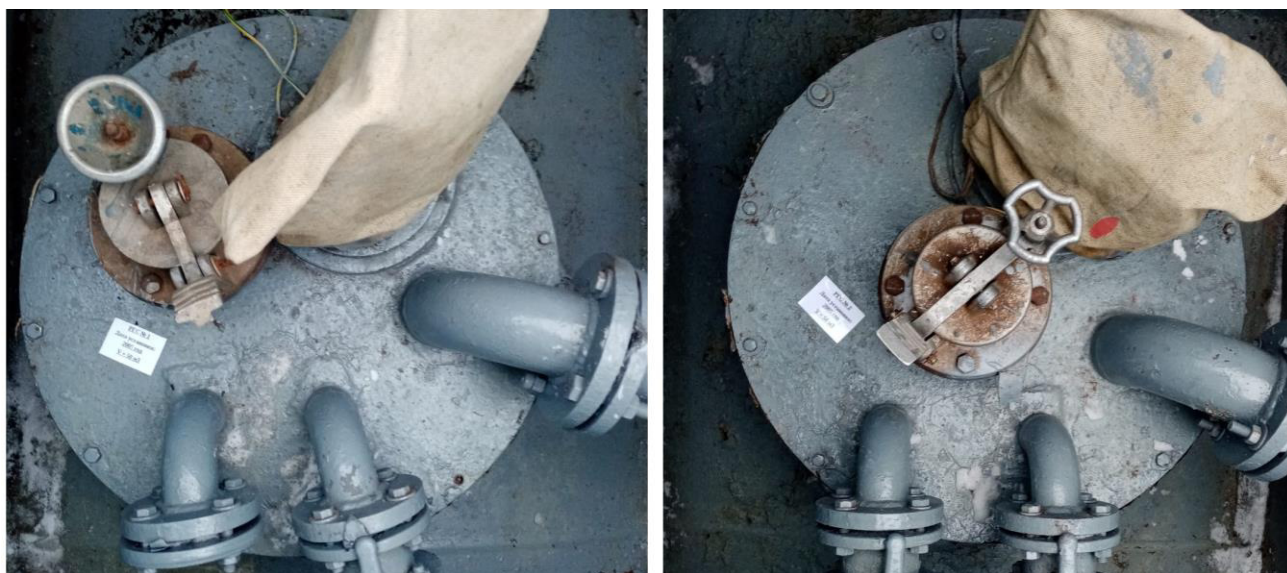
Рисунок 2 – Горловины резервуаров РГС-50 зав.№№1, 2