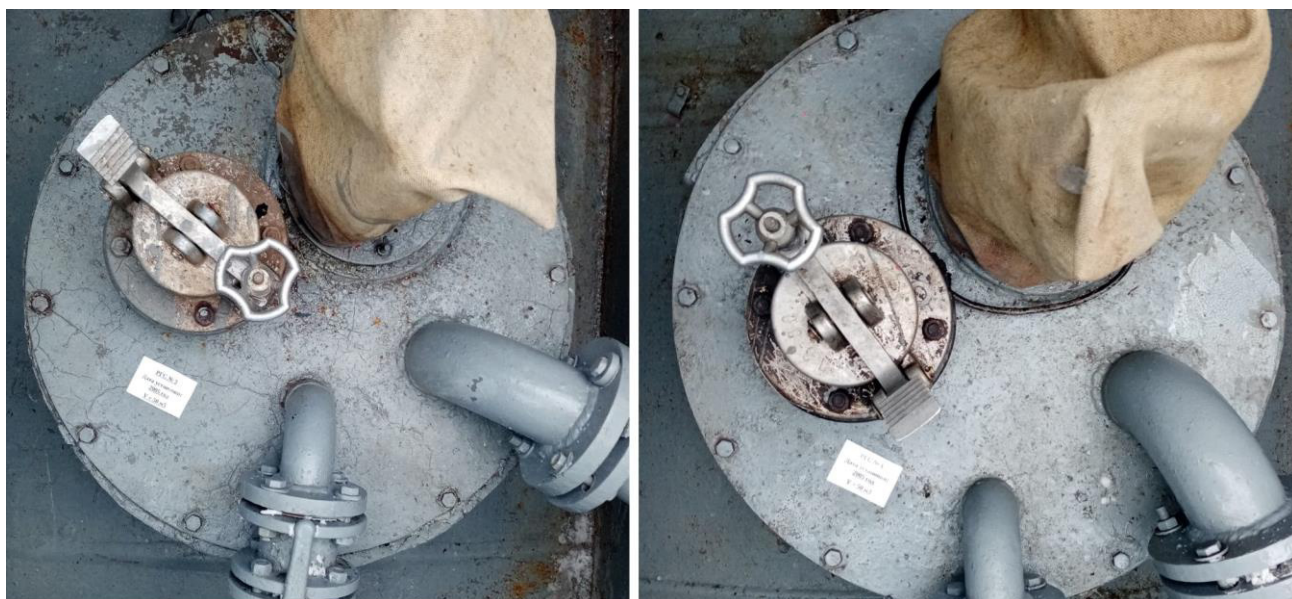
Рисунок 3 – Горловины резервуаров РГС-50 зав.№3, 4

Пломбирование резервуаров РГС-50 не предусмотрено.