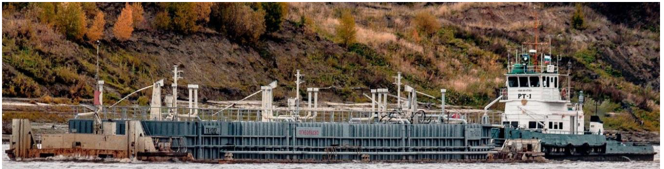
Р и с у н о к 1 – Общий вид несамоходного наливного судна ТК-1202

Общий вид несамоходного наливного судна ТК-1202 представлен на рисунке 1.