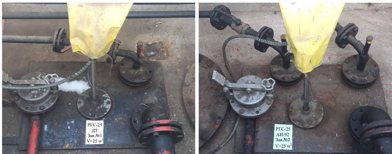
Рисунок 2 – Горловины резервуаров РГС-25 зав.№№1, 2