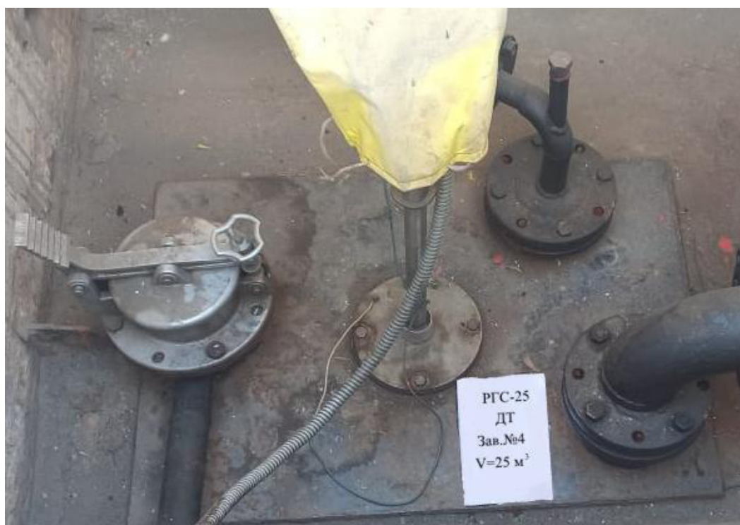
Рисунок 4 – Горловина резервуара РГС-25 зав.№4

Пломбирование резервуаров РГС-25 не предусмотрено.