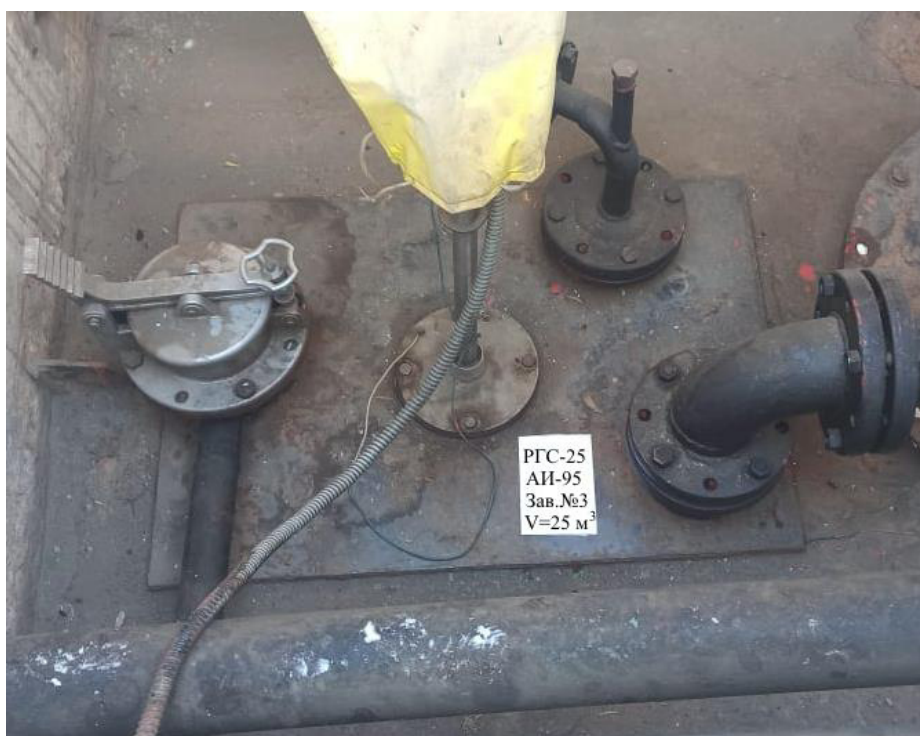
Рисунок 3 – Горловина резервуара РГС-25 зав.№3