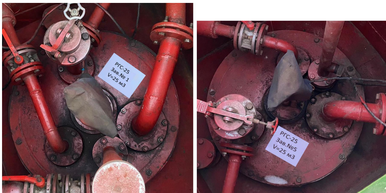
Рисунок 2 – Горловины резервуаров РГС-25 зав.№ 1, 5