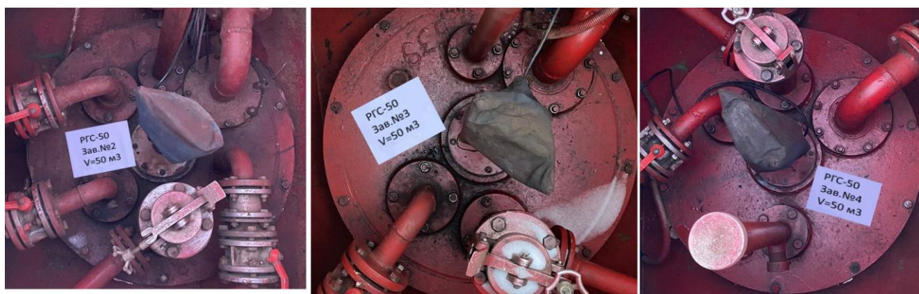
Рисунок 3 –Горловины резервуаров РГС-50 зав.№№ 2, 3, 4

Пломбирование резервуаров РГС не предусмотрено.