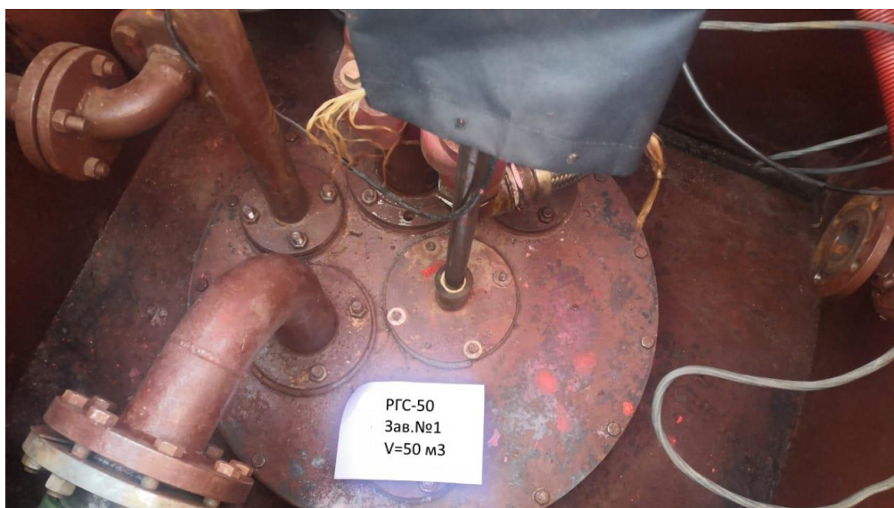
Рисунок 3 – Горловина резервуара РГС-50 зав.№ 1

Пломбирование резервуаров РГС не предусмотрено.