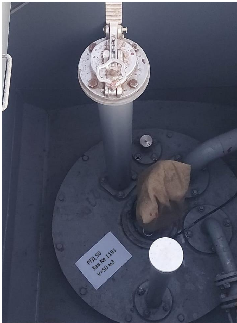
Рисунок 3 – Горловина резервуара РГД 50 зав.№ 1191

Пломбирование резервуаров РГД 50 не предусмотрено.