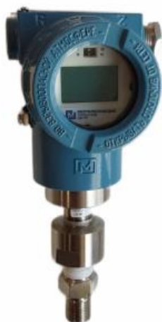
модели МСД-22-ИИ, МСД-22-АИ

Конструкция датчиков не предусматривает нанесение на корпус знака поверки.