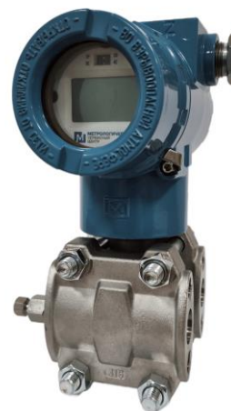
модели МСД-22-ДД, ДД(16, 25, 32, 40) МСД-22-ИД, МСД-22-ДА