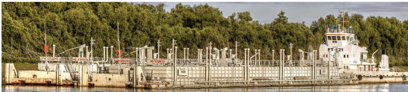
Р и с у н о к 1 – Общий вид несамоходного наливного судна ТК-1201

Общий вид несамоходного наливного судна ТК-1201 представлен на рисунке 1.