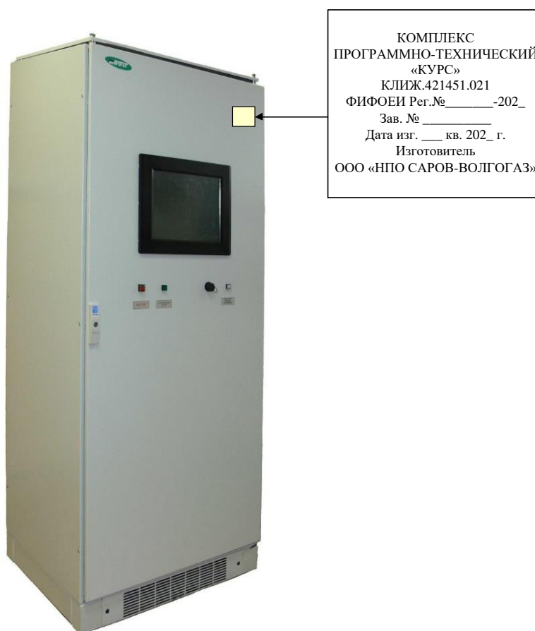
Рисунок 1 - Внешний вид шкафа ПТК, с указанием места нанесения заводского номера

Нанесение знака поверки на комплекс не предусмотрено. Пломбирование комплекса не предусмотрено.