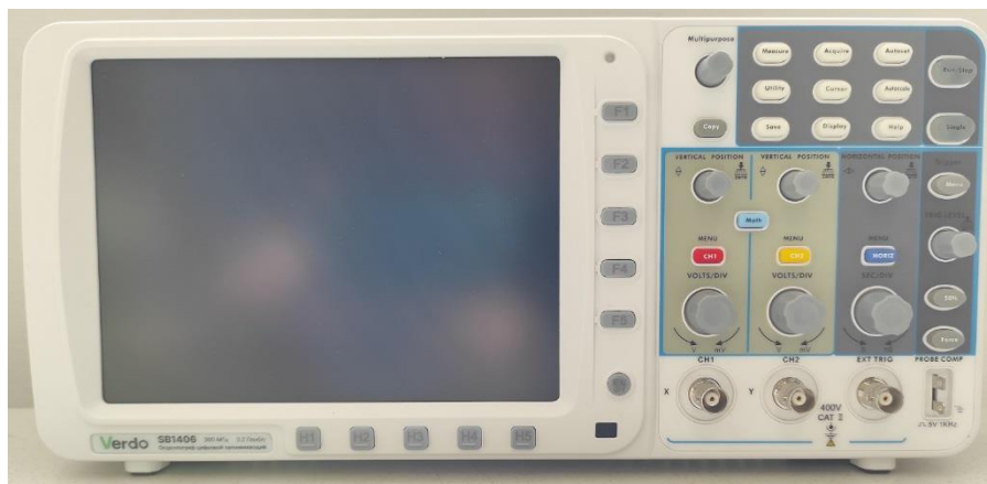
Рисунок 1 – Общий вид осциллографов, передняя панель