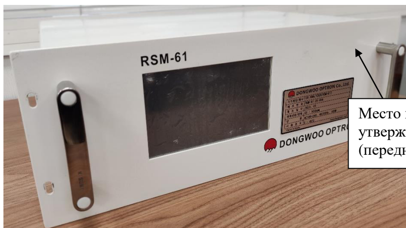
Рисунок 1 – Общий вид анализатора

Пломбирование анализаторов не предусмотрено.