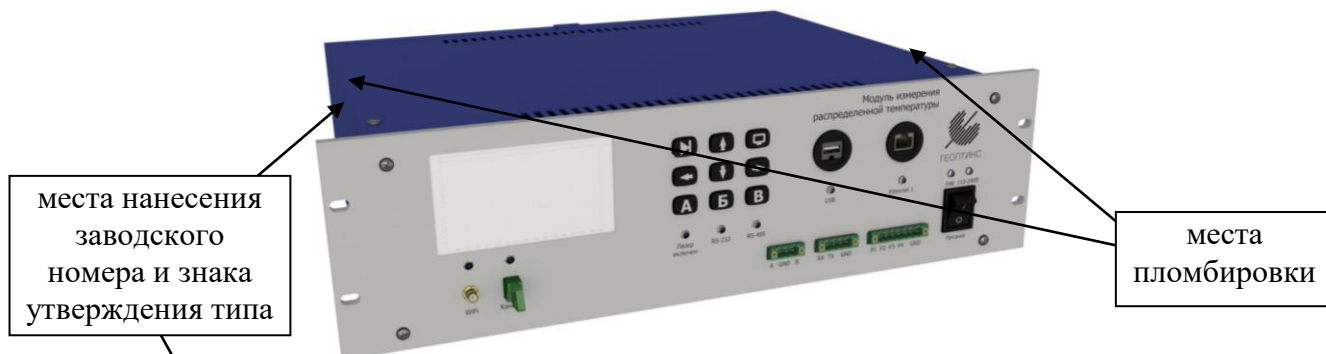
Рисунок 1 – Общий вид корпуса модулей с дисплеем

Внешний вид корпусов модулей с указанием мест нанесения знака утверждения типа и заводского номера, а также с указанием места пломбировки представлен на рисунках 1-3. Внешний вид конструкции измерительного кабеля представлен на рисунке 4. Цветовая гамма корпуса модулей может быть изменена изготовителем. Внешний вид измерительного кабеля может существенно отличаться от приведенного на рисунке 4.