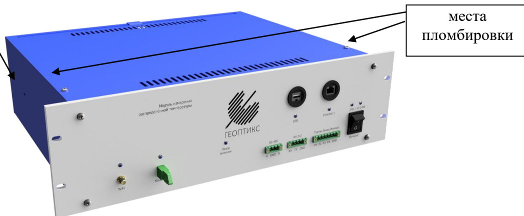
Рисунок 2 – Общий вид корпуса модулей без дисплея