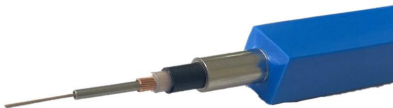
Рисунок 4 – Внешний вид конструкции измерительного кабеля

Заводской номер модулей в виде цифрового кода наносится на металлизированную наклейку, клеящуюся на боковую или заднюю панель корпуса модуля. Конструкция модулей не предусматривает нанесение знака поверки на средство измерений. Пломбирование модулей осуществляется при помощи пломбировочной наклейки, разрушаемой при отклеивании.