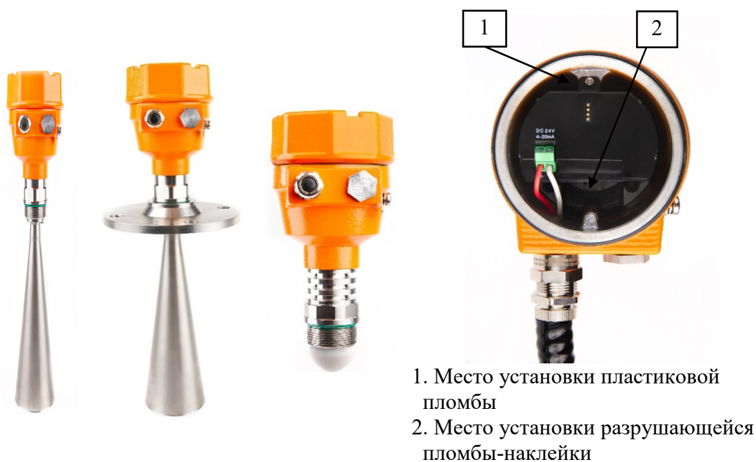
Рисунок 1 – Общий вид уровнемеров с указанием места пломбировки