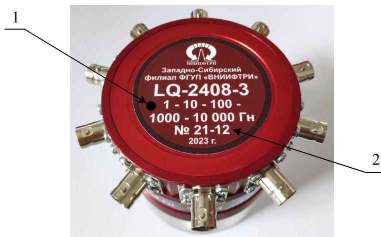
Рисунок 2 – Общий вид меры LQ-2408-3: 1 – место нанесения наклейки знака утверждения типа; 2 – место нанесения заводского номера.

Общий вид меры LQ-2408-3 представлен на рисунке 2.