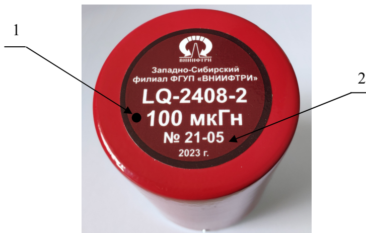
Рисунок 1 – Общий вид меры LQ-2408-2: 1 – место нанесения наклейки знака утверждения типа; 2 – место нанесения заводского номера.

Общий вид меры LQ-2408-2 представлен на рисунке 1.