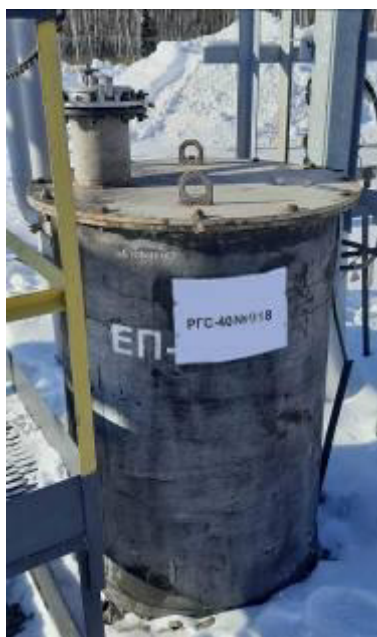
Рисунок 2 – Общий вид заливной горловины