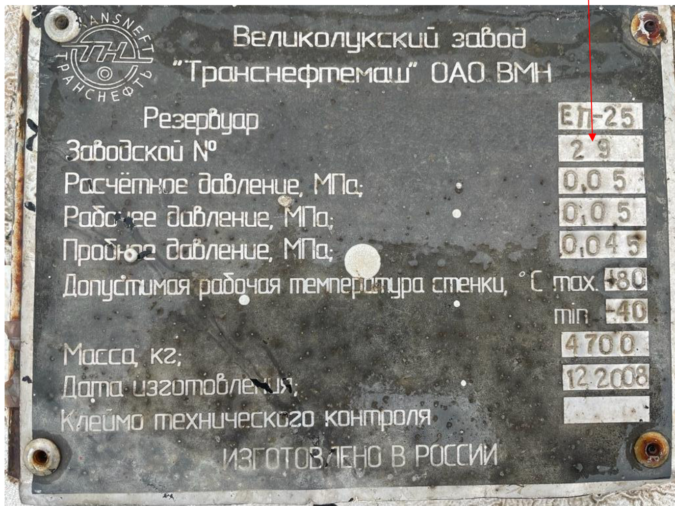
Рисунок 3 – Фотография с указанием места нанесения заводского номера резервуара

Пломбирование резервуара и нанесение знака поверки на резервуар не предусмотрено.