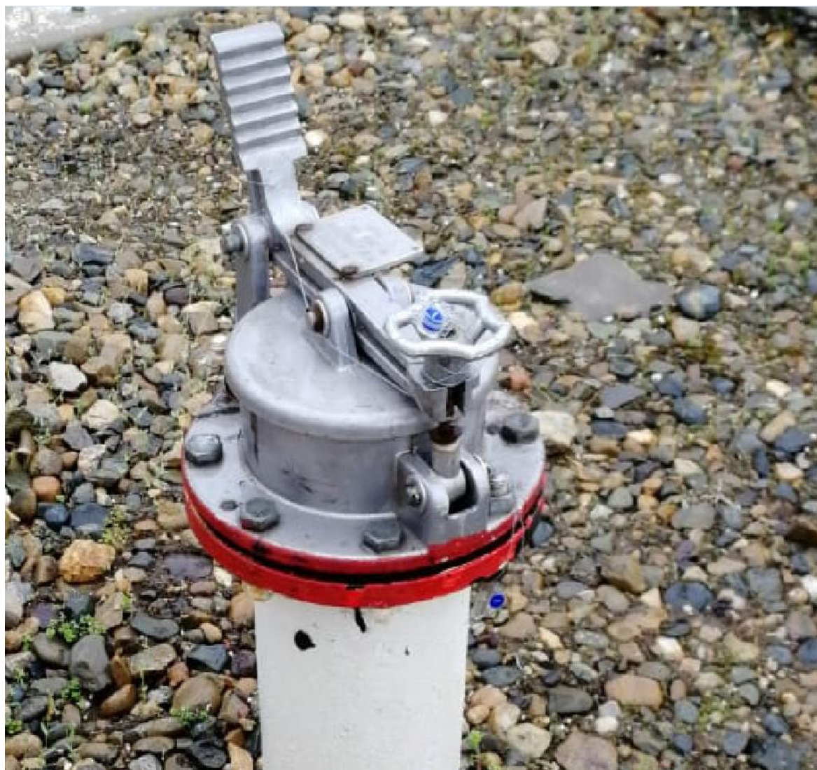
Рисунок 2 - Фотография горловины и крышки замерного люка резервуара