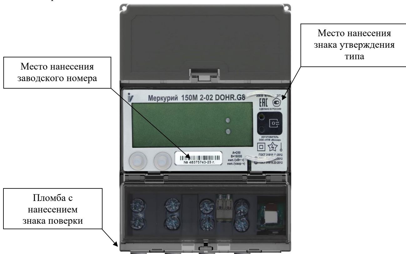
Рисунок 1 – Общий вид счетчиков модификаций Меркурий 150М, Меркурий 150 с указанием места ограничения доступа к местам настройки (регулировки), места нанесения знака утверждения типа, места нанесения заводского номера

Общий вид счетчиков с указанием места ограничения доступа к местам настройки (регулировки), мест нанесения знака утверждения типа и заводского номера представлен на рисунках 1 и 2. Способ ограничения доступа к местам настройки (регулировки) – пломба со знаком поверки.