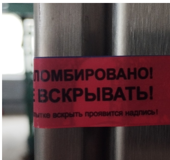
Рисунок 3 – Схема пломбировки шкафов комплекса

Пломбирование шкафа комплекса осуществляется с помощью контровочной проволоки, проведенной через специальное отверстие, и запорно-пломбировочного устройства или индикаторной ленточной пломбы в виде наклейки. Схема пломбировки шкафов комплекса от несанкционированного доступа представлена на рисунке 3. Нанесение знака поверки на комплекс не предусмотрено.