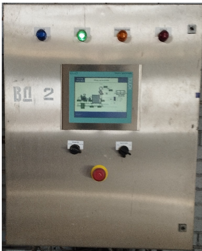
Рисунок 1 – Общий вид комплекса

Комплекс обеспечивает выполнение следующих основных функций: