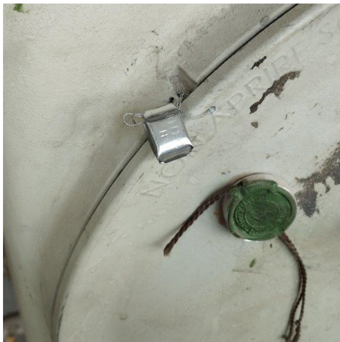
Рисунок 3 – Схема пломбировки шкафов комплекса