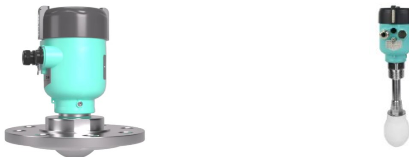
Рисунок 1 – Внешний вид уровнемеров

Нанесение знака поверки на уровнемеры не предусмотрено.