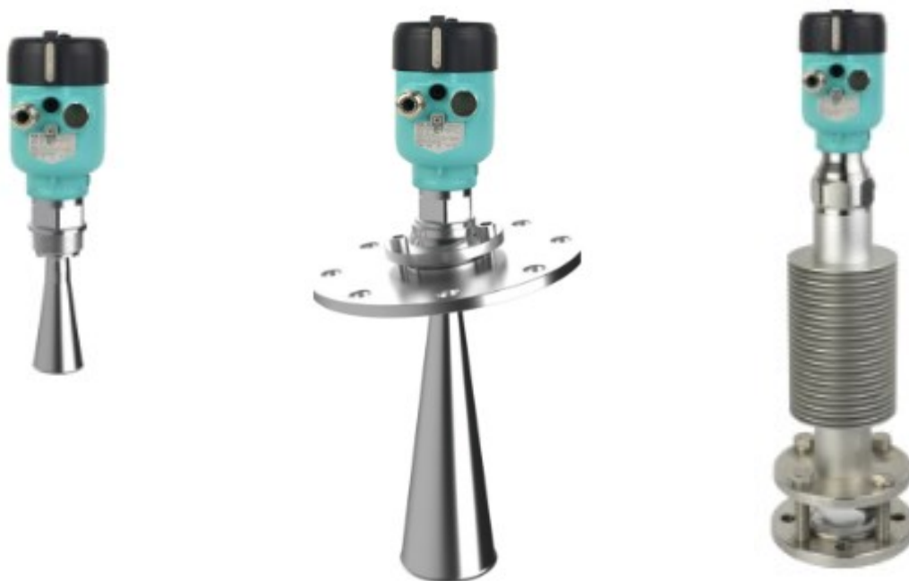
в) фланцевое присоединение для высокотемпературного исполнения

Общий вид уровнемеров представлен на рисунке 1.