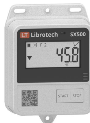
Рисунок 2 – Общий вид измерителей-регистраторов с измерительными каналами типа: H, P