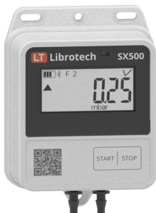
Рисунок 3 – Общий вид измерителей-регистраторов с измерительным каналом типа: Pd