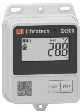
Рисунок 1 – Общий вид измерителей-регистраторов с измерительными каналами типа: T, Te, He, F, Fe, K, I, U

Общий вид измерителей-регистраторов с указанием места нанесения знака утверждения типа, места нанесения заводского номера представлен на рисунках 1-4. Нанесение знака поверки на измерители-регистраторы не предусмотрено. Пломбирование мест настройки (регулировки) измерителей-регистраторов не предусмотрено.