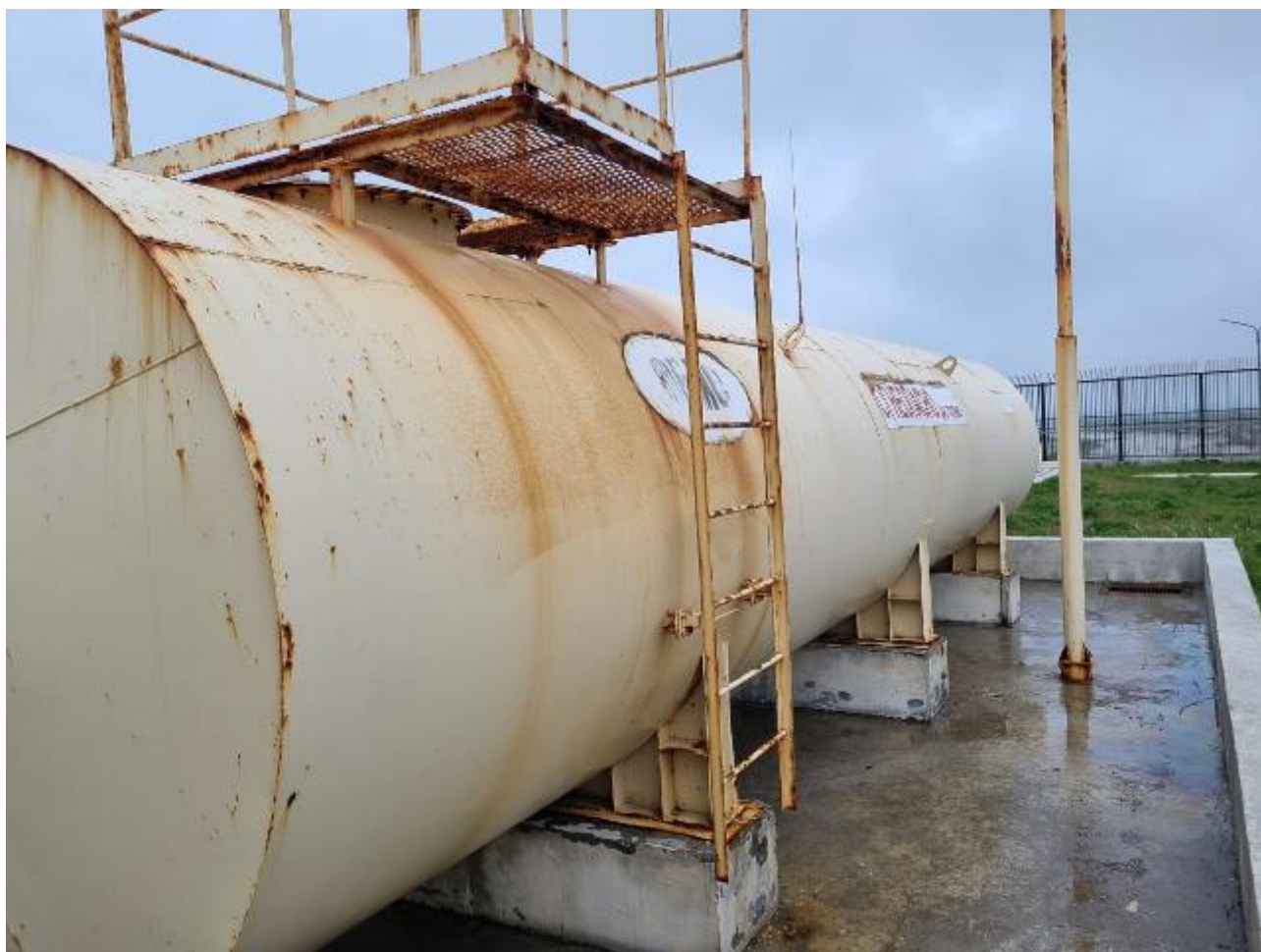
Рисунок 2 – Общий вид резервуара РГСН-50 Пломбирование резервуара РГСН-50 не предусмотрено.