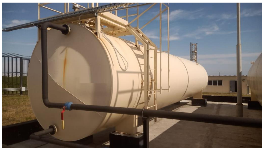
Рисунок 4 – Общий вид резервуара РГСН-50 зав.№ 78