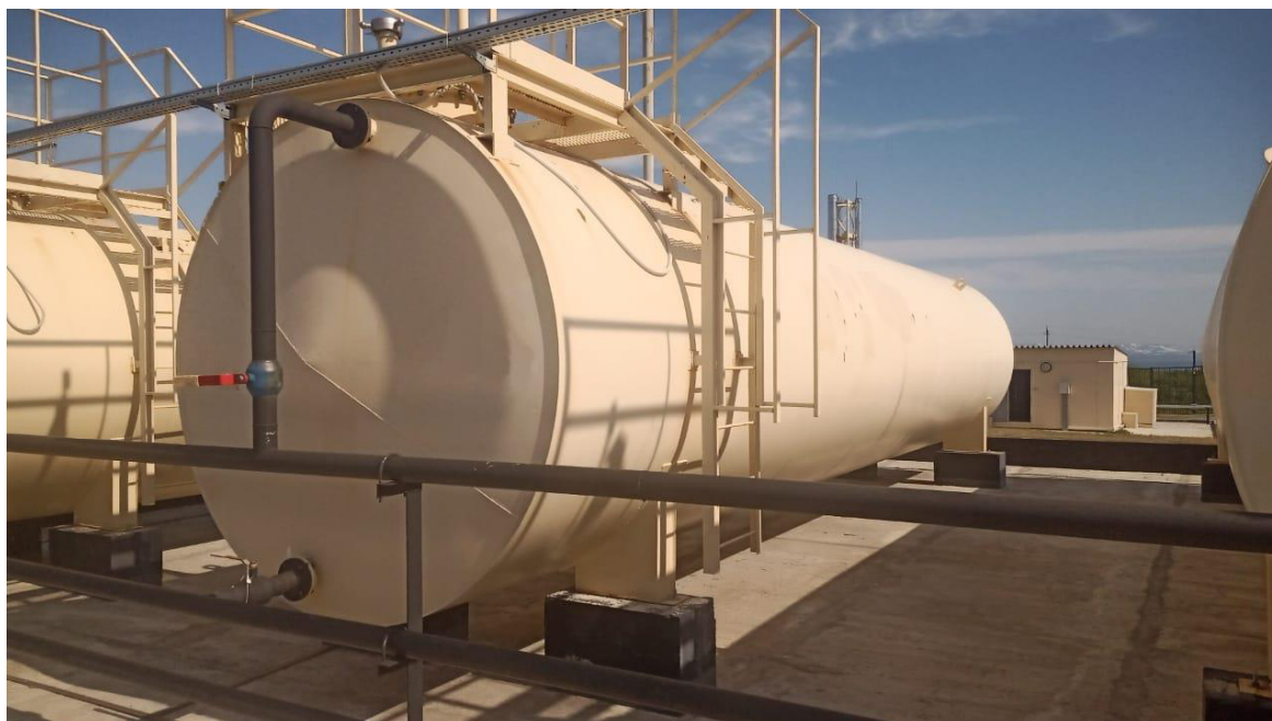
Рисунок 5 – Общий вид резервуара РГСН-50 зав.№ 84