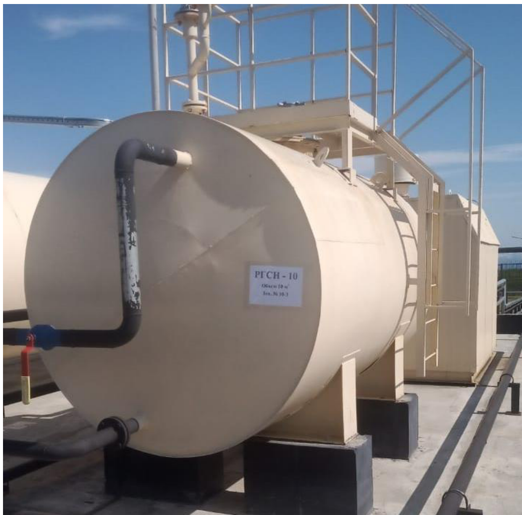
Рисунок 3 – Общий вид резервуара РГСН-10 зав.№ 10-3