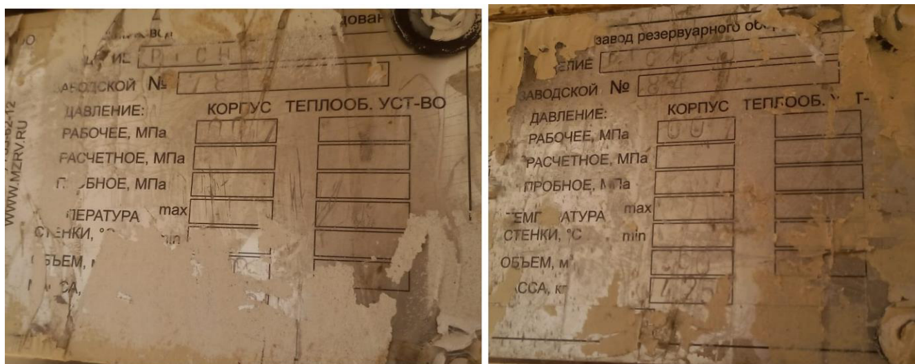
Рисунок 1 – Маркировочные таблички резервуаров РГСН-50 зав.№№78, 84