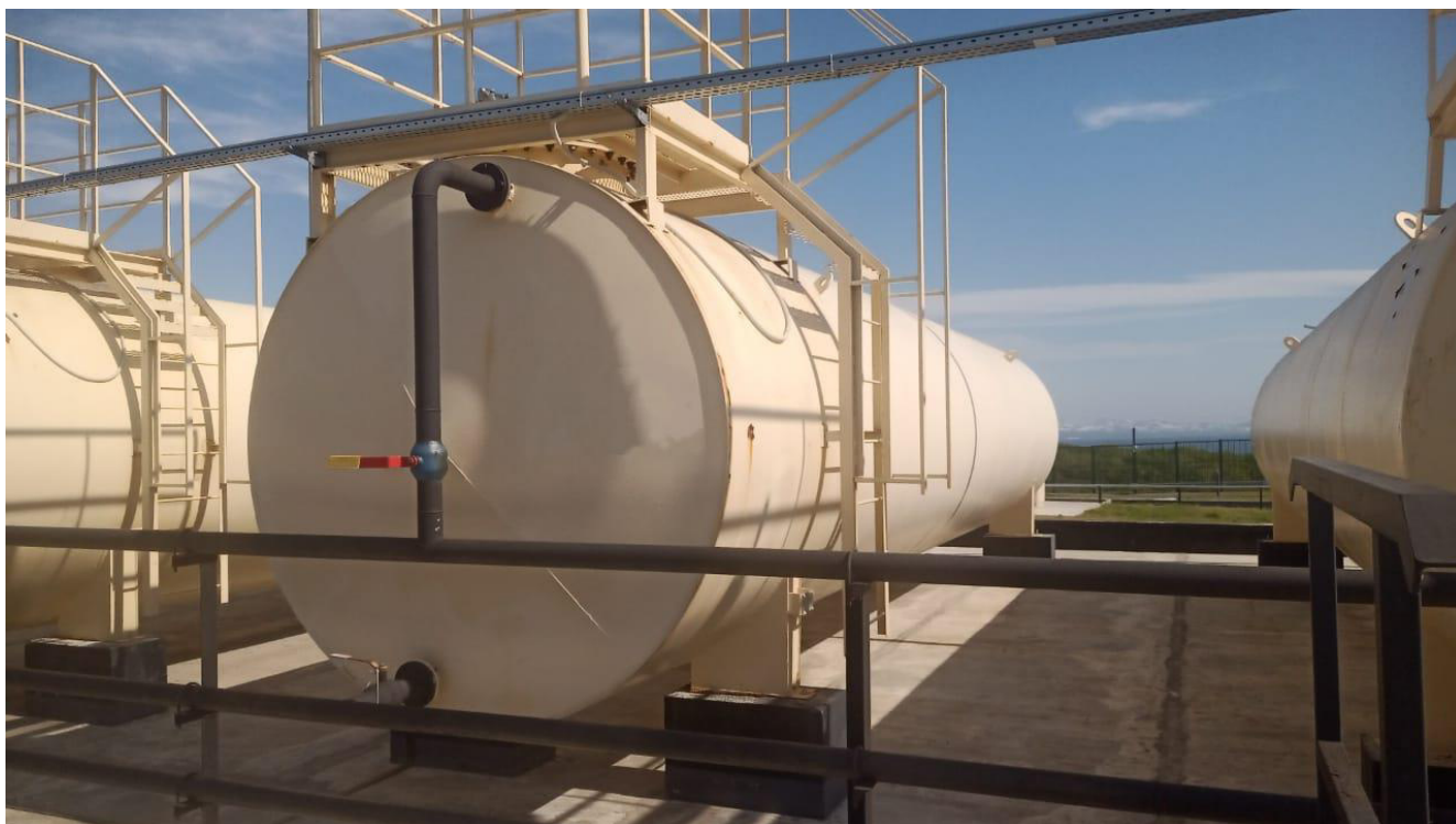
Рисунок 7 – Общий вид резервуара РГСН-50 зав.№ 106 Пломбирование резервуаров РГСН не предусмотрено.