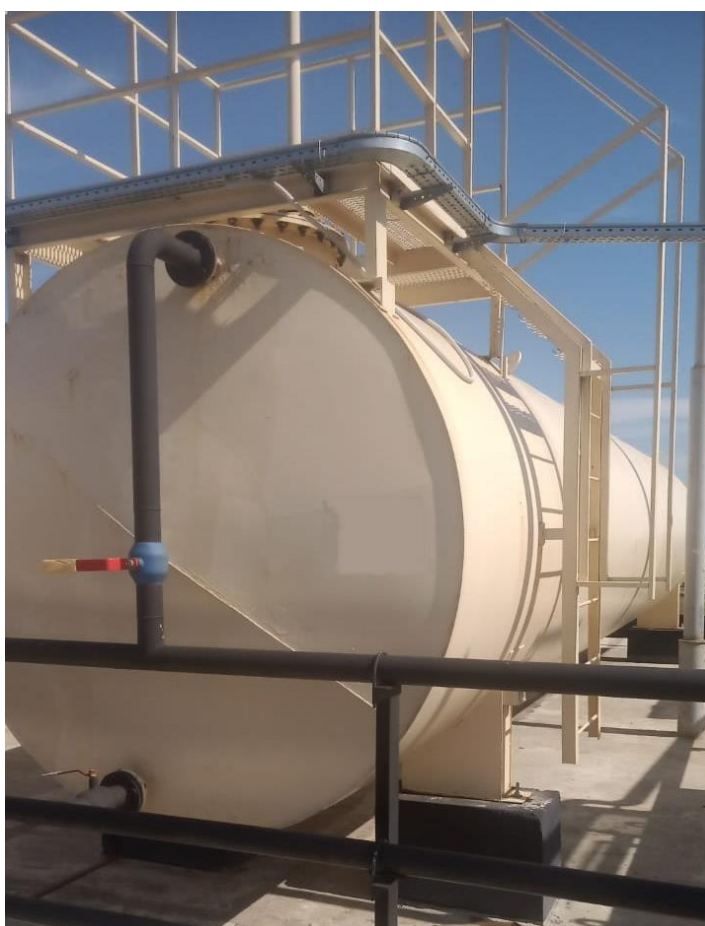
Рисунок 6 – Общий вид резервуара РГСН-50 зав.№ 105