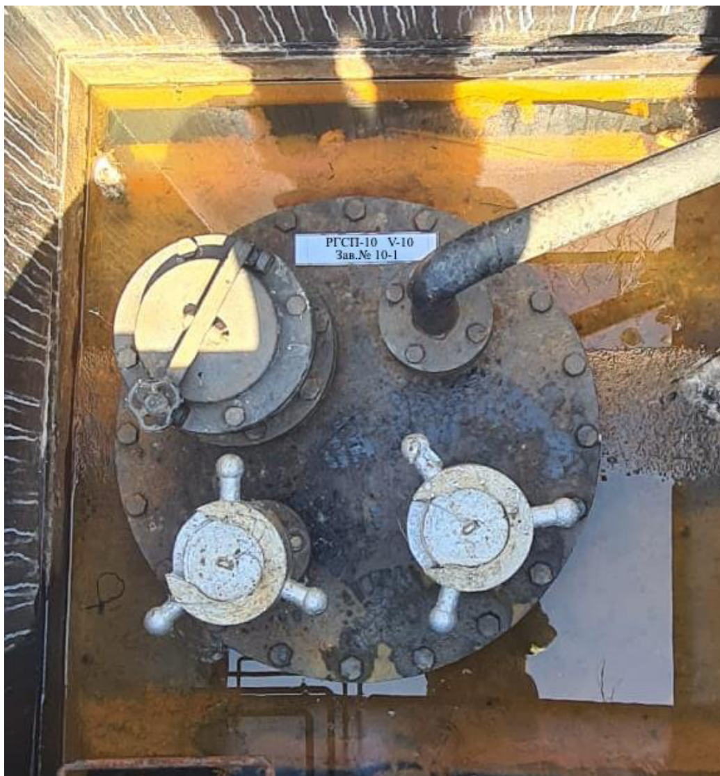
Рисунок 2 – Горловина резервуара РГСП-10 зав.№10-1

Пломбирование резервуара РГСП-10 не предусмотрено.