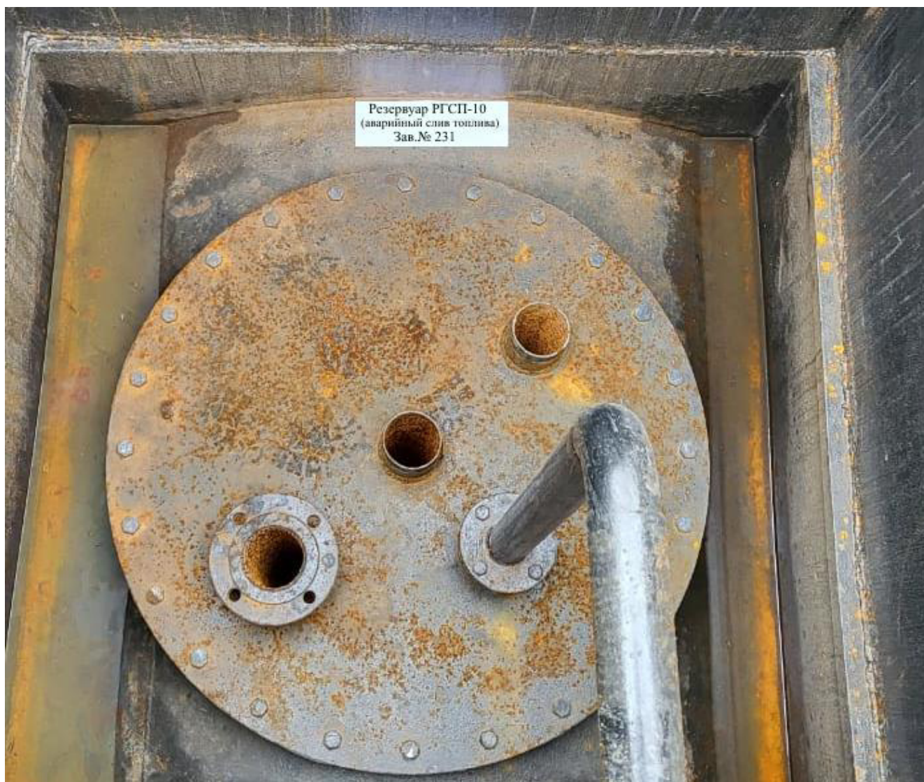
Рисунок 2 – Горловина резервуара РГСП-10

Пломбирование резервуара РГСП-10 не предусмотрено.