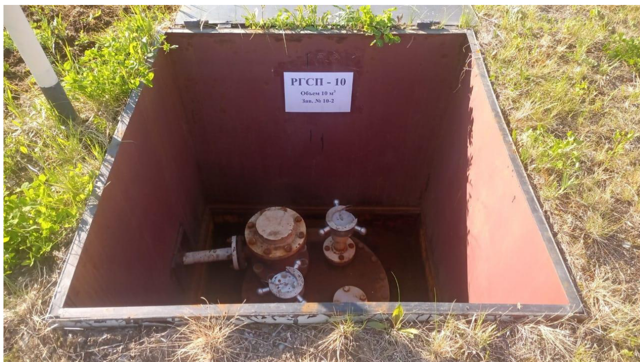
Рисунок 2 – Горловина резервуара РГСП-10

Пломбирование резервуара РГСП-10 не предусмотрено.