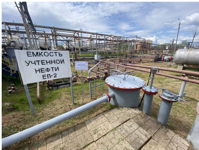
Рисунок 2 – Общий вид заливной горловины