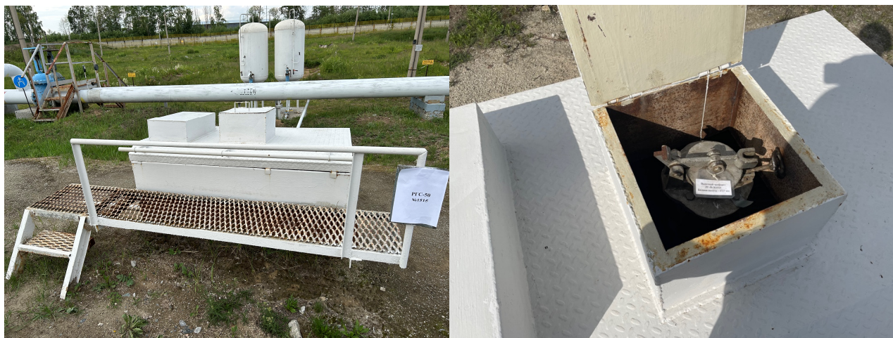
Рисунок 2 – Общий вид резервуара и заливной горловины