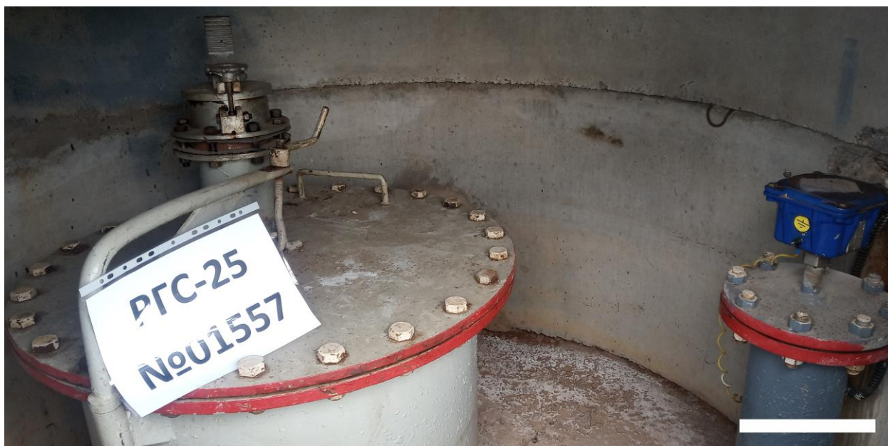
Рисунок 2 – Общий вид заливной горловины