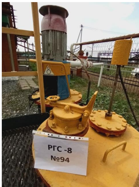
Рисунок 2 – Общий вид заливной горловины