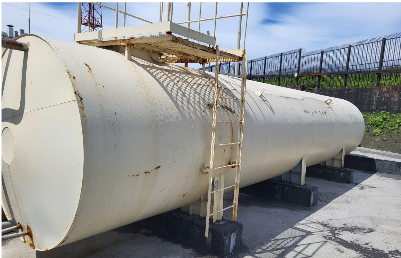
Рисунок 2 – Общий вид резервуара РГСН-50 Пломбирование резервуара РГСН-50 не предусмотрено.