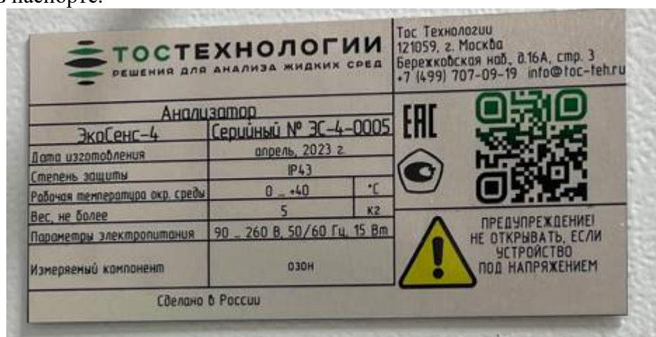
Рисунок 1 - Пример маркировочной таблички

Серийный номер датчика отображен на соединительном кабеле или корпусе датчика, а также приведен в паспорте.