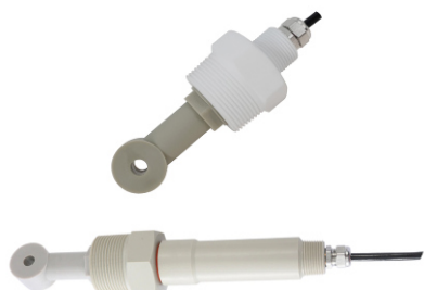
34) ЭС-COND-И-ПП-1-D-60, ЭС-COND-И-ПП-3-D-60, ЭС-COND-И-ПП-1-D-100, ЭС-COND-И-ПП-3-D-100, ЭС-COND-И-ПП-1-A-60, ЭС-COND-И-ПП-3-A-60, ЭС-COND-И-ПП-1-A-100, ЭС-COND-И-ПП-3-A-100