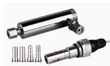
27) ЭС-COND-1-A-316-5, ЭС-COND-2-A-316-5, ЭС-COND-3-A-316-5 в комплекте с проточной ячейкой