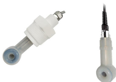
35) ЭС-COND-И-ПФА-1-D-150, ЭС-COND-И-ПФА-3-D-150, ЭС-COND-И-ПФА-1-A-150, ЭС-COND-И-ПФА-3-A-150