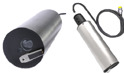
23) ЭС-TSS-3198-12, ЭС-TURB-3199-12