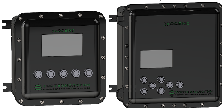
д) ЭкоСенс-X 1 -X 2