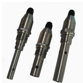
31) ЭС-COND-1-A-316-1, ЭС-COND-2-A-316-1, ЭС-COND-3-A-316-1