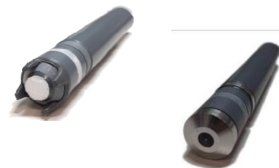
33) ЭС-ClO2-xxx, ЭС-HClO- xxx, ЭС-TCl-xxx, ЭС-RCl-xxx, ЭС- O3