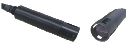
14) ЭС-1-TURB, ЭС-1-TSS