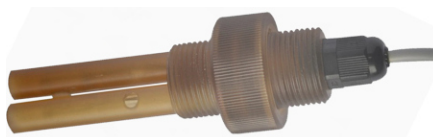
26) ЭС-COND-4-A-ПСФ-1, ЭС-COND-5-A-ПСФ-1