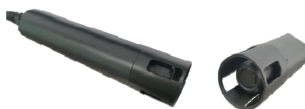
13) ЭС-1- DO