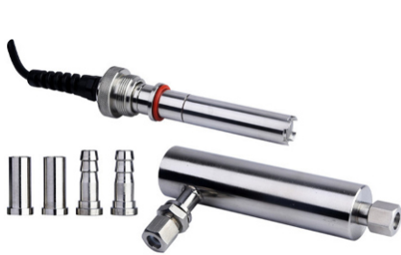
19) ЭС-DO-309-5 в комплекте с проточной ячейкой