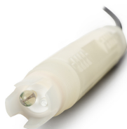
7) ЭС-PH-9121-Ф, ЭС-PH-9123-Ф, ЭС-ORP- 9194-Ф