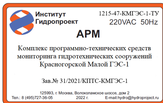
Рисунок 3 – Общий вид маркировочной таблички

В процессе эксплуатации комплекс не предусматривает внешних механических или электронных регулировок. Ограничение несанкционированного доступа к узлам комплекса обеспечено запираемыми влагозащитными шкафами.