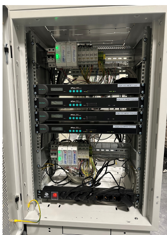
Шкаф вычислительного комплекса