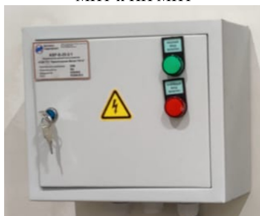
Щит управления вычислительного комплекса и бесперебойного питания