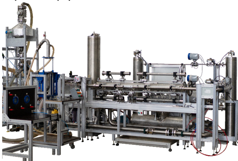
Рисунок 1 - Внешний вид установки поверочной расходомерной ULTRA-S-AL

Схемы пломбирования от несанкционированного доступа, обозначение мест нанесения знака поверки приведены на рисунке 3.