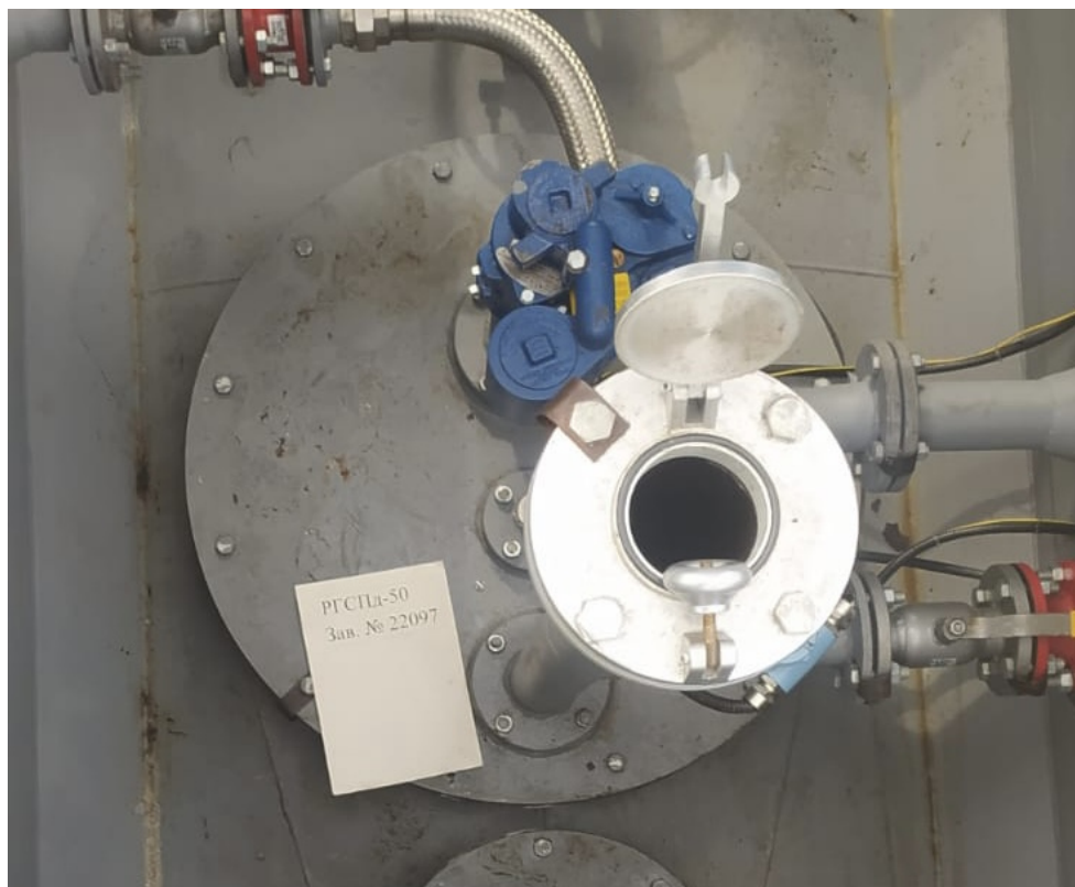
Рисунок 2 – Горловина и измерительный люк резервуара РГСЦд-50 зав.№ 22097 Пломбирование резервуара РГСЦд-50 не предусмотрено.