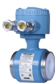
Датчик расхода модели Метран-370MW (с соединительной коробкой)