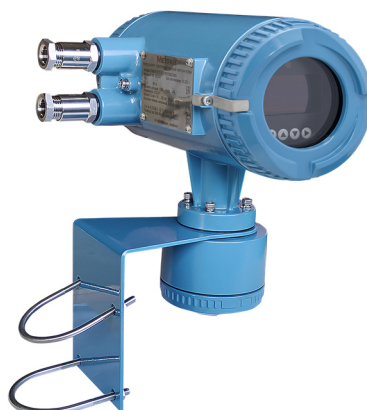
Измерительный преобразователь удаленного монтажа для крепления на кронштейне