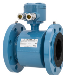
Датчик расхода моделей Метран-370MF, Метран-370MS, Метран-370MP (с соединительной коробкой)