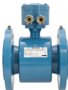
Датчик расхода модели Метран-370MR (с соединительной коробкой)