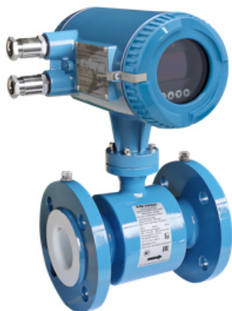
Измерительный преобразователь интегрального монтажа (с датчиком фланцевого исполнения)