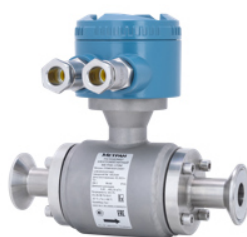
Датчик расхода модели Метран-370MH (с соединительной коробкой)