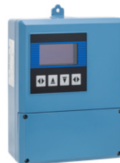
Измерительный преобразователь удаленного монтажа настенного исполнения