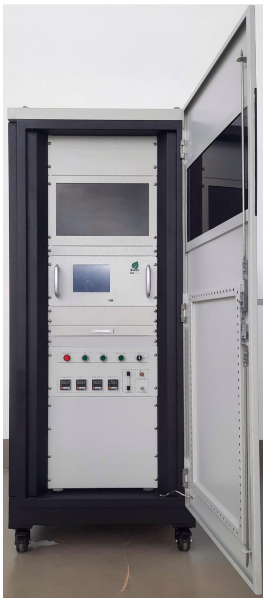
Рисунок 1 – Общий вид комплексов