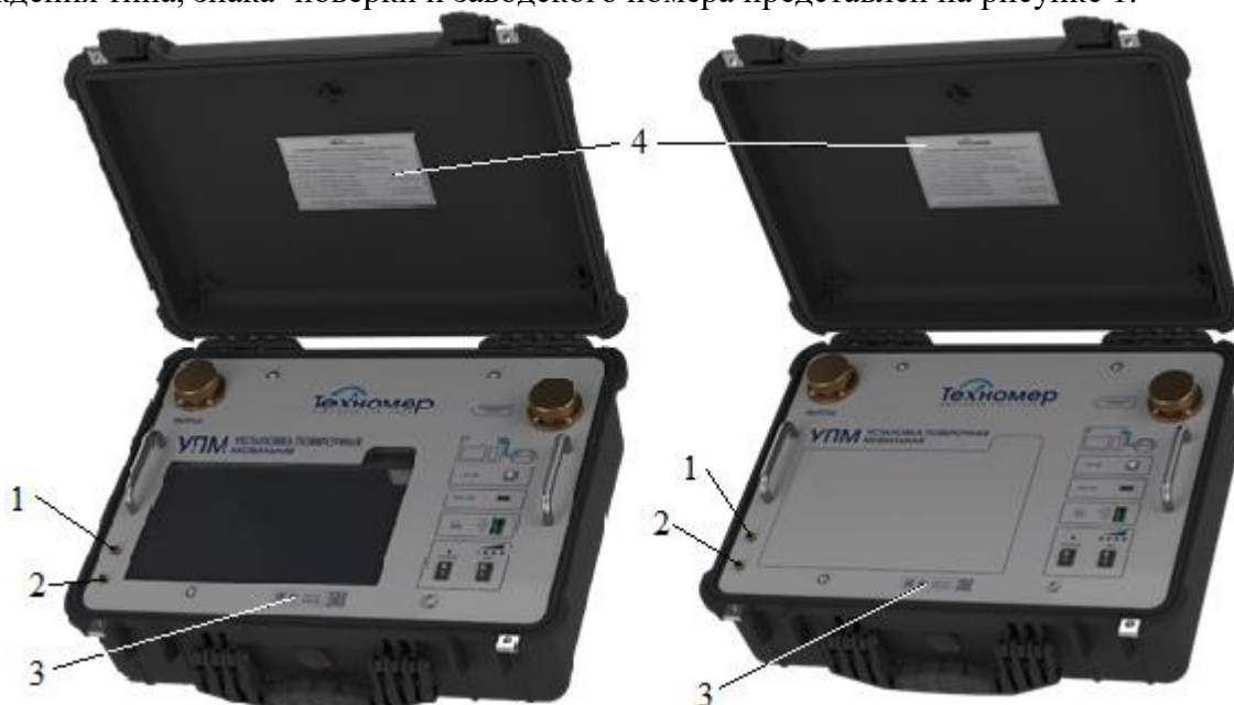
Рисунок 1 – Общий вид установок поверочных мобильных УПМ модификации 1 (со встроенной ЭВМ) и модификации 2 (с внешней ЭВМ)

Общий вид установок с указанием мест пломбировки, мест нанесения знака утверждения типа, знака поверки и заводского номера представлен на рисунке 1.