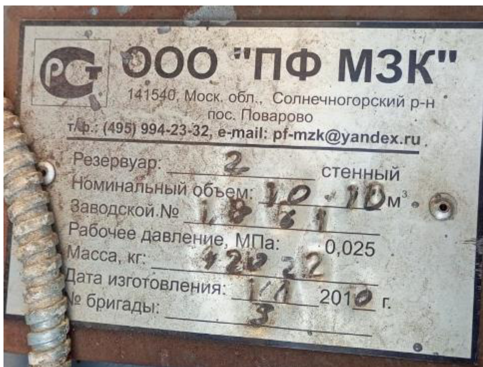
Рисунок 1 – Маркировочная табличка резервуара