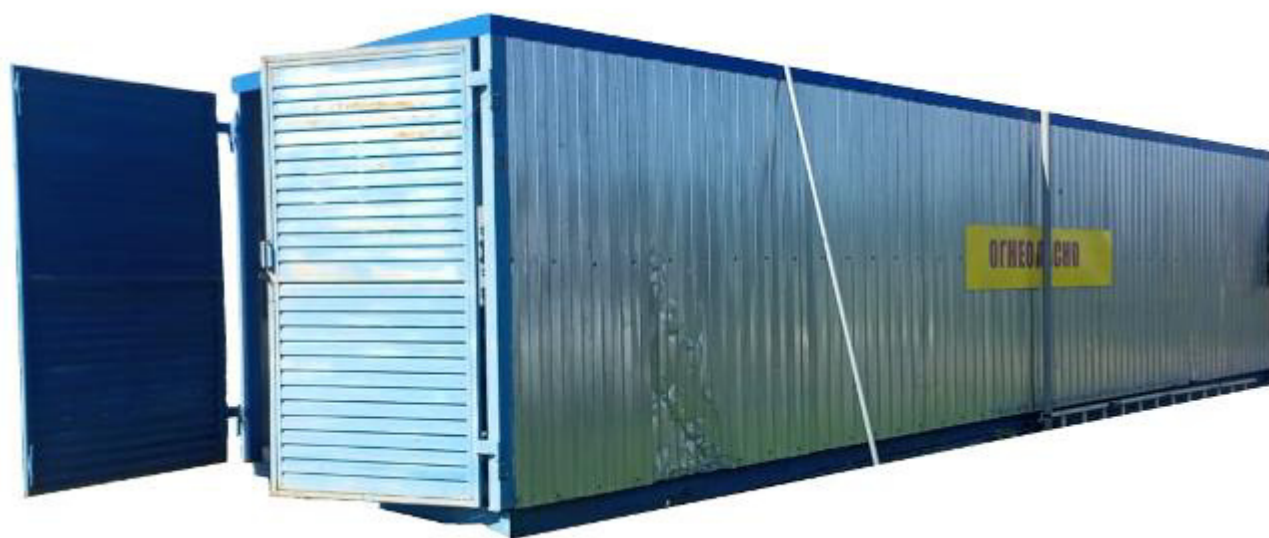
Рисунок 2 – Общий вид резервуара РГ 20/2-П-02-УХЛ1ТУ